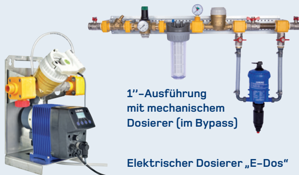
1"-Ausführung mit mechanischem Dosierer (im Bypass)

Elektrische Dosierer sind in zwei Versionen (E-Dos / E-Dos Touch) und jeweils drei Baugrößen mit unterschiedlichen Durchflussmengen erhältlich. Unsere hydraulischen Dosierer sind in unterschiedlichen Ausführungen erhältlich. Fordern Sie unsere Dosierer-Prospekte an oder informieren Sie sich auf → www.lubing.de .